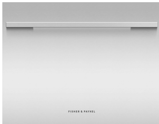
en option: DD60ST-KIT porte acier inoxydable EZKleen