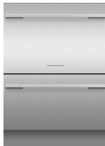
In optie: DD60DT-KIT EZKleen RVS deurpanelenset