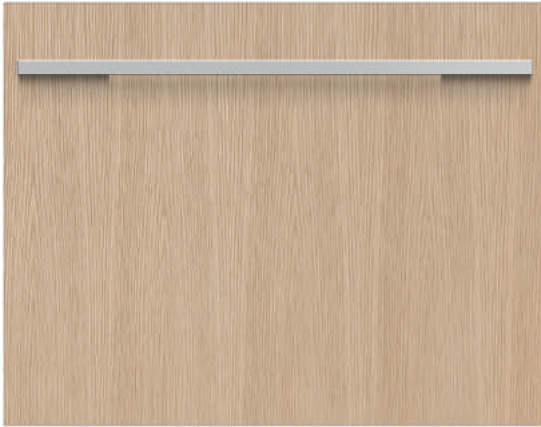
finition standard: avec panneau personnalisé