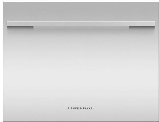
en option: DD60ST porte acier inoxydable EZkleen