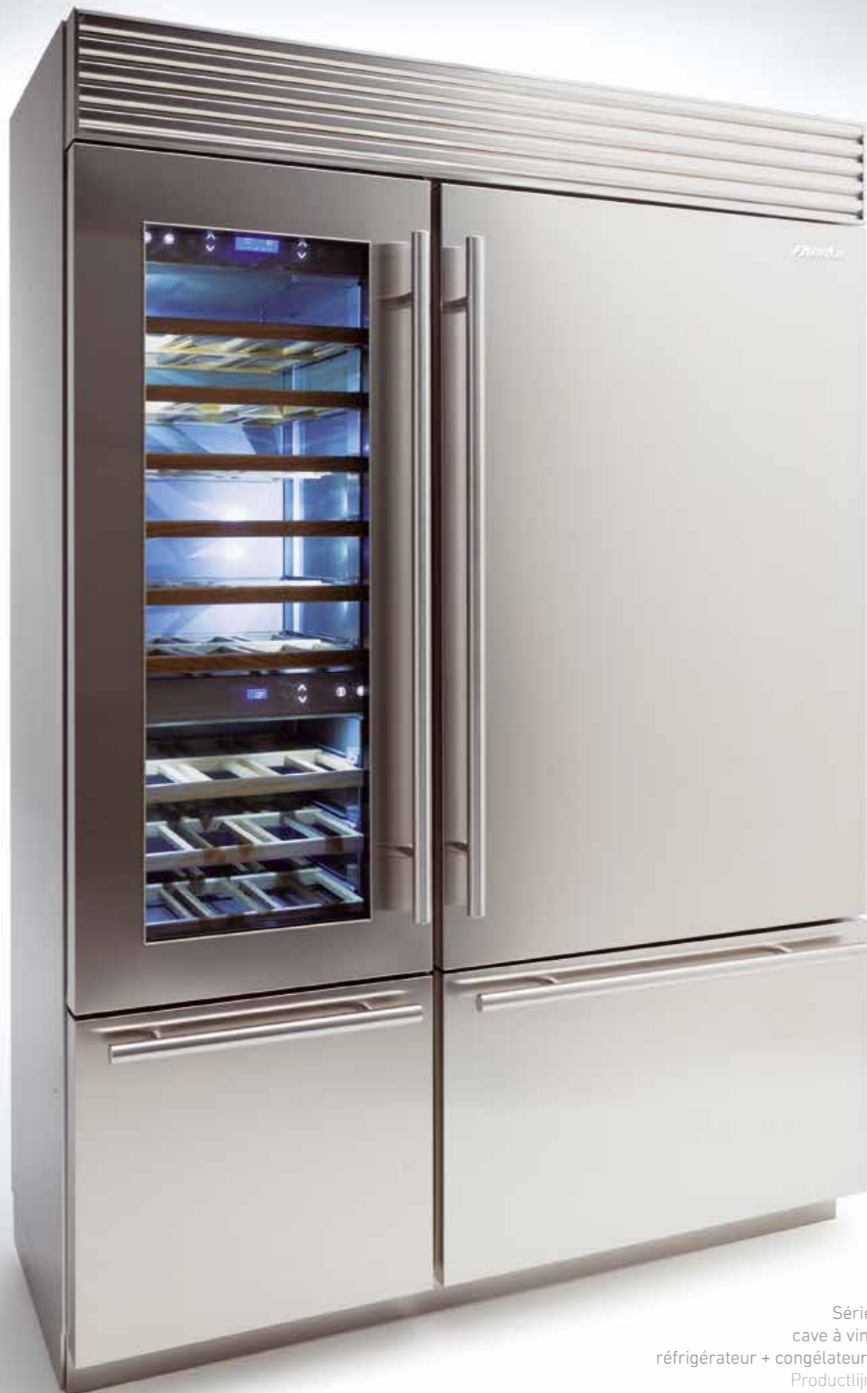
Série X PRO cave à vin 599 1T réfrigérateur + congélateur 899 0T Productlijn X PRO wijnklimaatkast 599 1T koelkast + vriezer 899 0T

Le design de la série X-Pro, caractérisé par la grille supérieure d'aération et les poignées tubulaires en acier inoxydable satiné, a été étudié pour satisfaire les passionnés du look professionnel et reflète les hauts contenus technologiques de tous les modèles de la gamme Fhiaba.