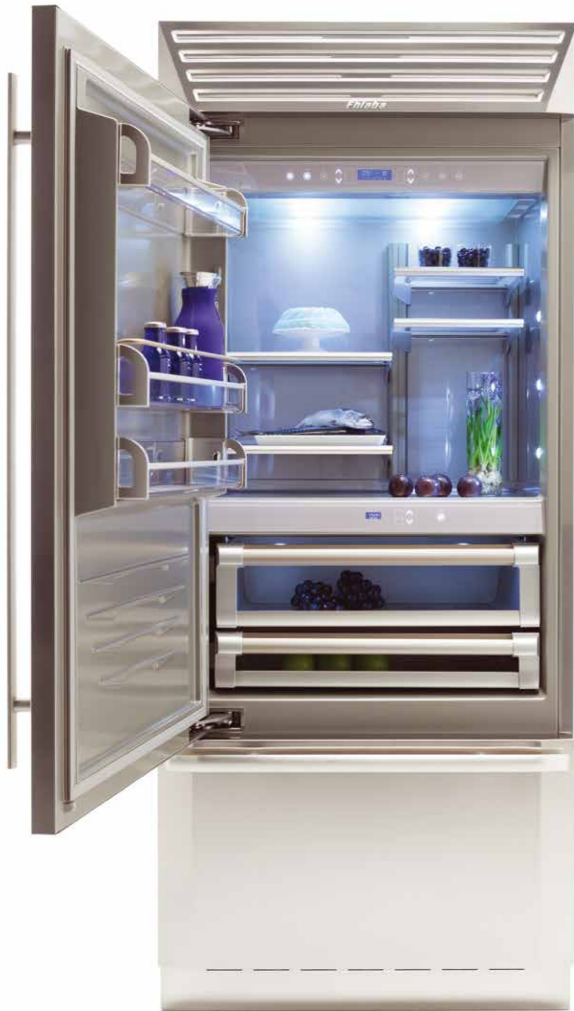
Série STANDPLUS réfrigérateur + congélateur 899 1T Productlijn STANDPLUS koelkast + vriezer 899 1T

Even Lift™. Clayettes coulissantes sur crémaillères brevetées Fhiaba : elles peuvent être installées à n'importe quelle hauteur dans le compartiment réfrigérateur sans besoin de les vider ou de les retirer du compartiment. L'intérieur du réfrigérateur se transforme rapidement et aisément.