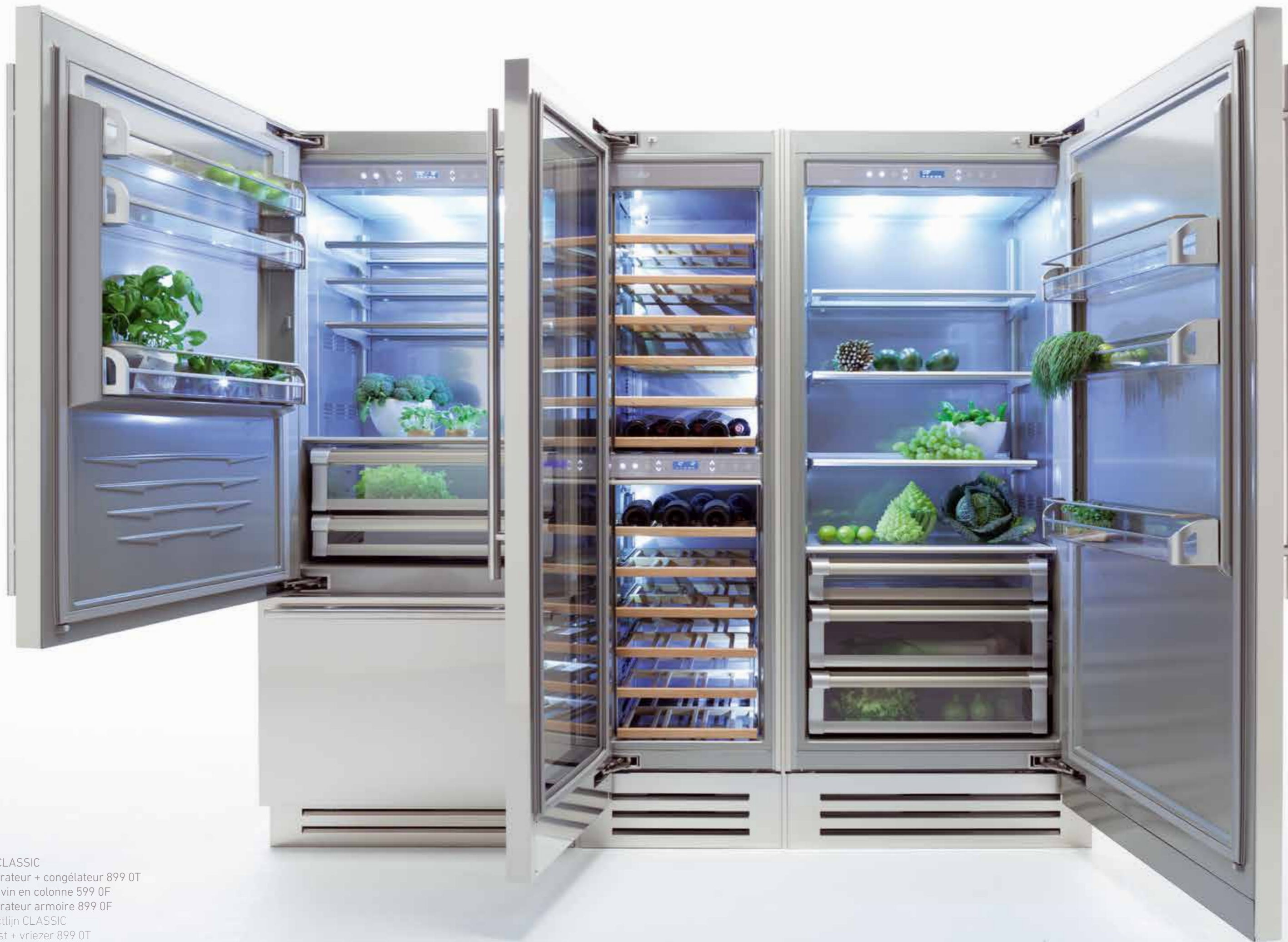
Série CLASSIC réfrigérateur + congélateur 899 0T cave à vin en colonne 599 0F réfrigérateur armoire 899 0F Productlijn CLASSIC koelkast + vriezer 899 0T kolom wijnklimaatkast 599 0F kolom koelkast 899 0F