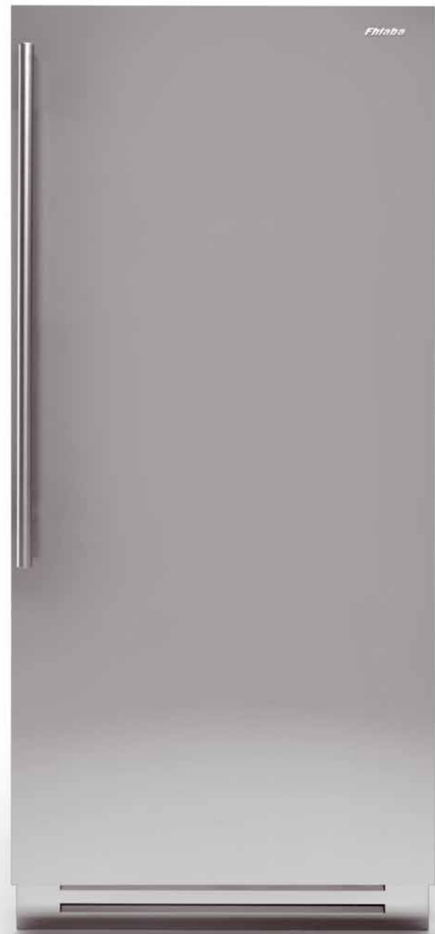
Série Classic réfrigérateur armoire 899 0F Productlijn CLASSIC kolom koelkast 899 0F