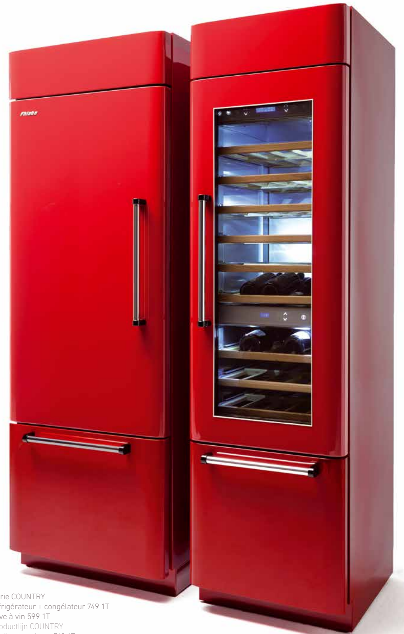
Série COUNTRY réfrigérateur + congélateur 749 1T cave à vin 599 1T Productlijn COUNTRY koelkast + vriezer 749 1T wijnklimaatkast 599 1T